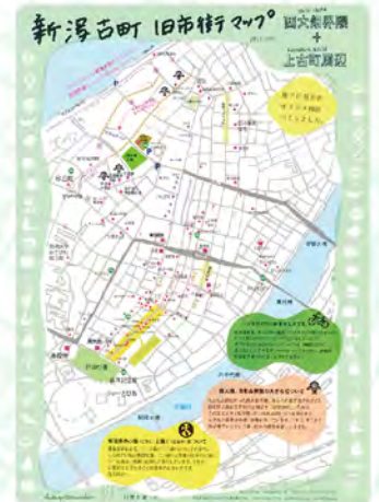
参考資料：新潟古町旧市街マップ