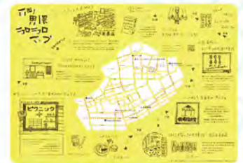
参考資料：古町界隈キョロキョロマップ