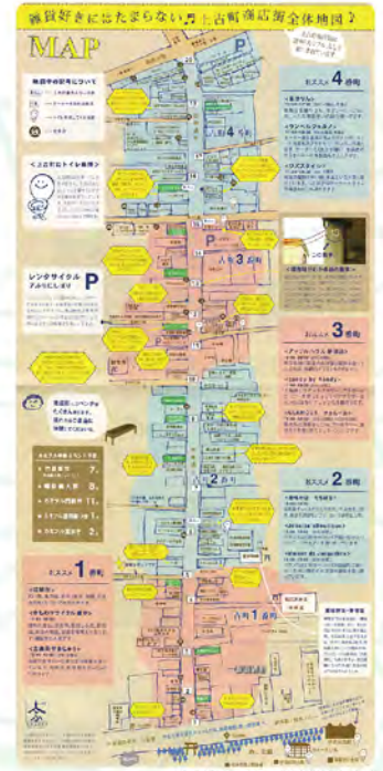
参考資料：上古町商店街全体地図